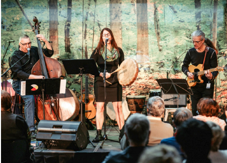
Prestation du quatuor Kawandak lors de Micro ouvert autochtone.