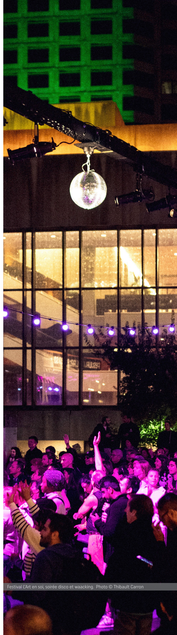
Festival L'Art en soi, soirée disco et waacking.