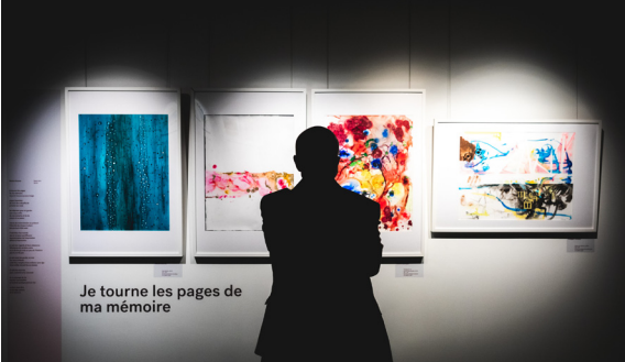
Je tourne les pages de ma mémoire