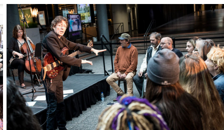
Atelier de chant avec l'organisme Les Impatients.