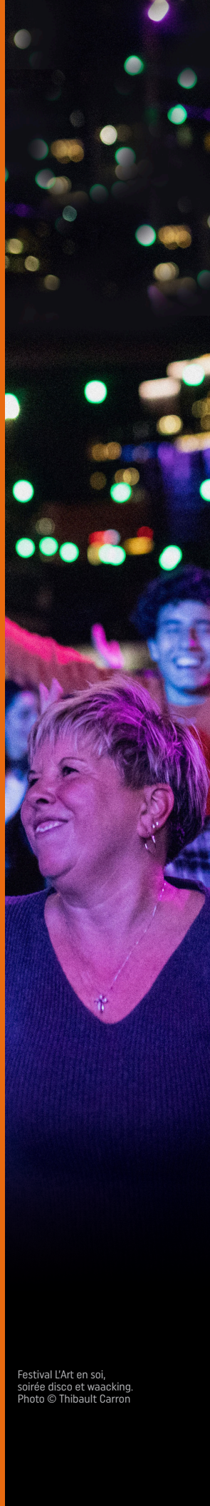
Festival L'Art en soi, soirée disco et waacking.

à l'accessibilité aux arts et la culture pour des dizaines de milliers de personnes de tous horizons incluant des familles, des élèves et des membres de différentes collectivités