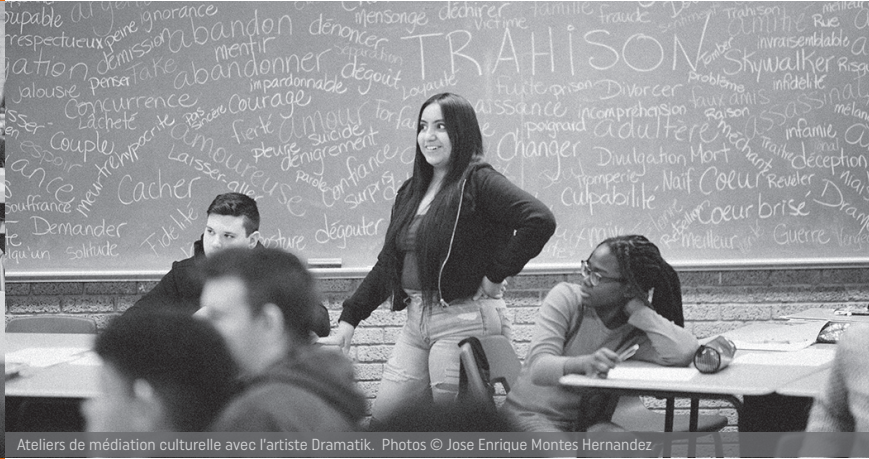
Ateliers de médiation culturelle avec l'artiste Dramatik.