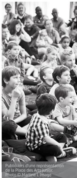
Public lors d'une représentation de la Place des Arts junior.

437 spectateurs aux représentations de la série Place des Arts Junior permettant aux enfants de s'initier aux arts de la scène en famille