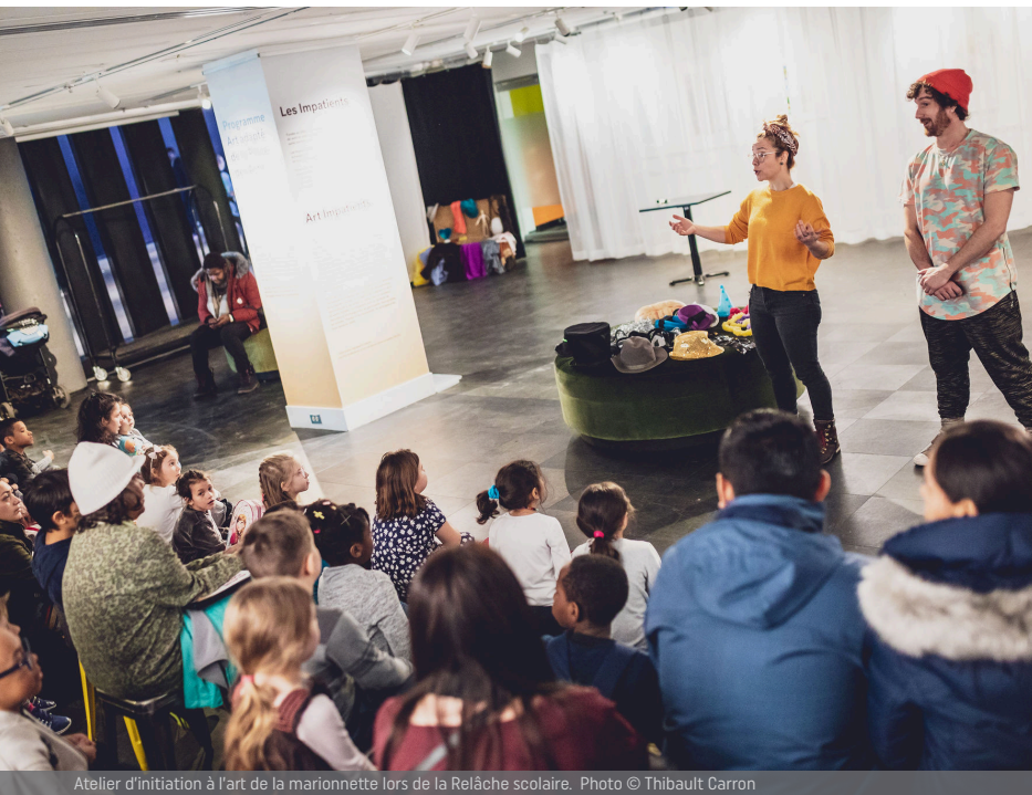
Atelier d'initiation à l'art de la marionnette lors de la Relâche scolaire.