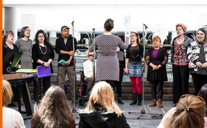
Représentation publique de la Fondation INCA.