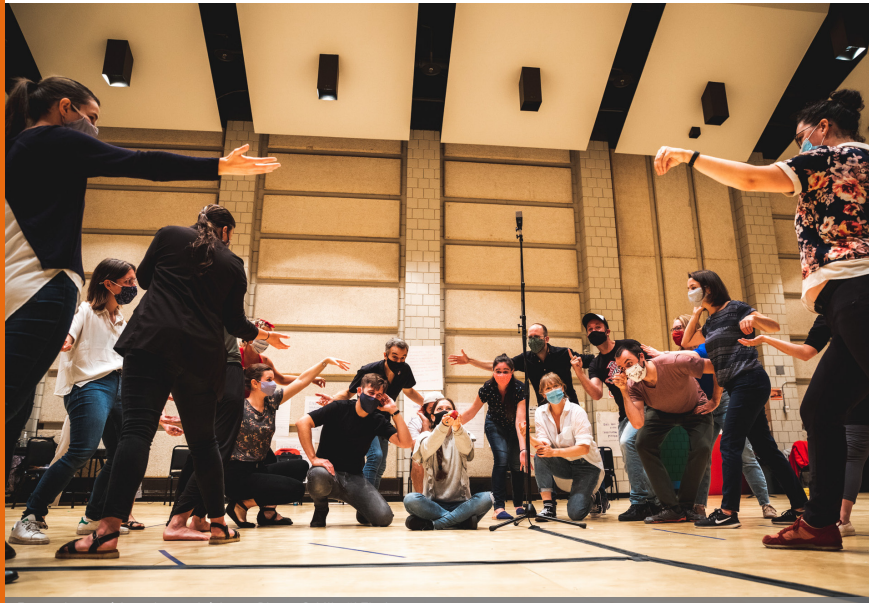
Formation en éducation esthétique.

Deux jours de formation aux enseignants souhaitant accompagner leurs groupes dans cet arrimage culture-éducation