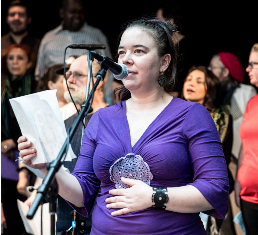
Représentation publique de l'organisme Sans oublier le sourire.

14 représentations publiques par les groupes participants dans les espaces publics de la Place des Arts