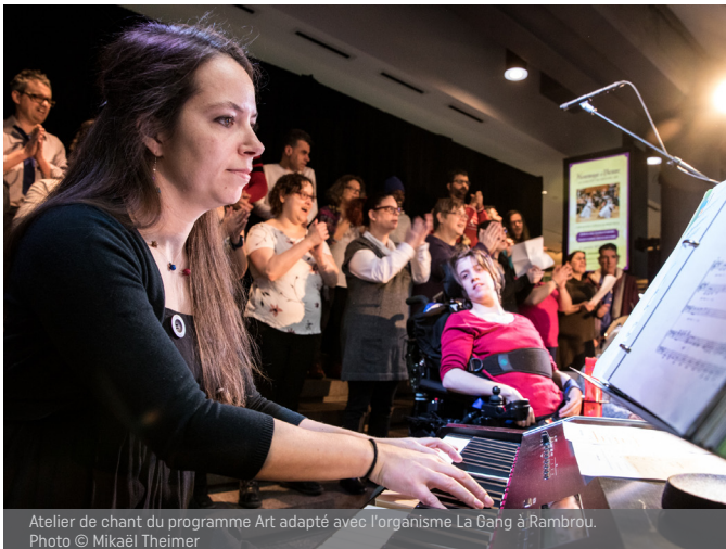
Atelier de chant du programme Art adapté avec l'organisme La Gang à Rambrou.

Elle souhaite également remercier le Groupe Banque TD pour sa contribution de 10 000 $ à la toute première édition de l'événement Micro ouvert autochtone.