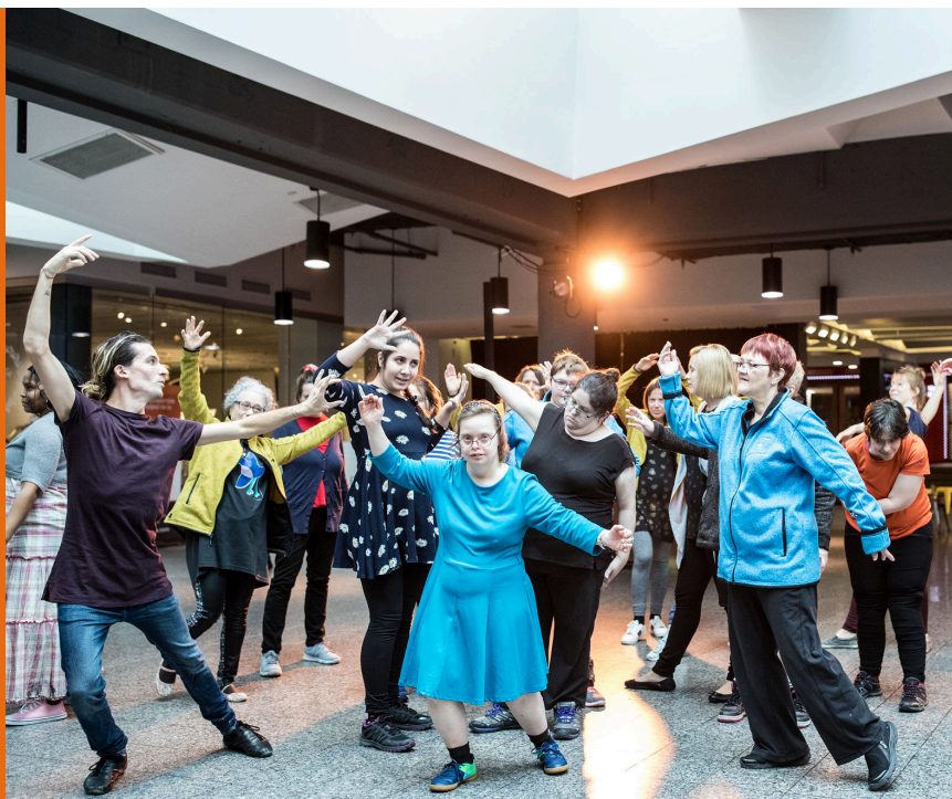
Atelier de danse avec l'organisme Atelier le Fil d'Ariane.