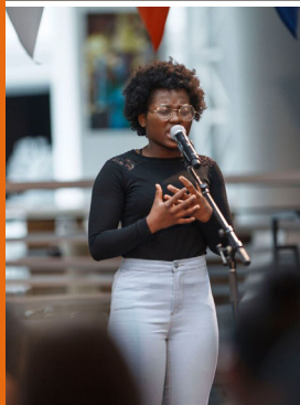
Prestation d'une élève lors du Marathon de slam.