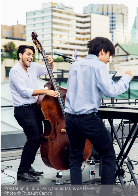
Prestation du duo Les rythmes latins de Marzo.