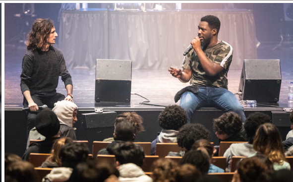
Discussion post-spectacle avec l'artiste Dramatik.