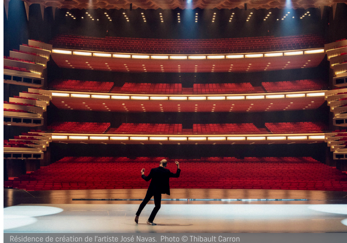
Résidence de création de l'artiste José Navas.